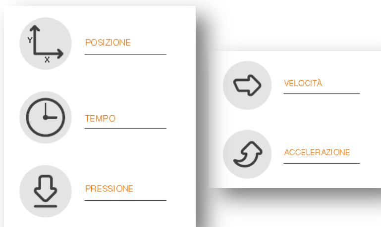
Fig.1 - Schema

Gli elementi disponibili nell'apposizione della sottoscrizione da parte del firmatario (di seguito CLIENTE), sono i dati biometrici e comportamentali, quali: Posizione della penna , Pressione , Tratto in aria (percorso che fa la penna quando non tocca nel device, fino a 1cm ), e Tempo . E' possibile elaborare velocità e accelerazione ai fini di analisi forensi.