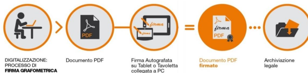
Fig.2 - Schema

La rappresentazione informatica della firma racchiude informazioni superiori alla raccolta delle firma autografa su carta. L'univocità della connessione viene garantita dalla sottoscrizione effettuata davanti all'operatore, previa identificazione del firmatario, e alla possibilità di effettuare opportuna perizia grafologica, in modo del tutto equivalente ad una firma su carta.